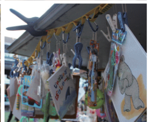
リサイクル絵本も当たる射的