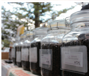
オーガニックコーヒー豆