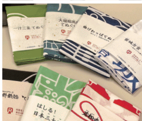
高校生が手掛けた手ぬぐい