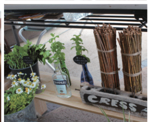
フレッシュハーブ