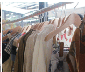
オーガニック Cotton の服