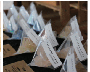
ハッカを使った琥珀糖