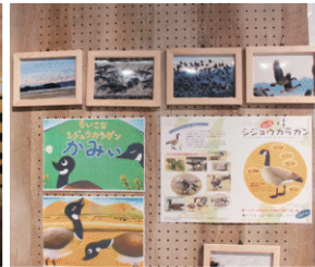
自然環境を学ぶワークショップ