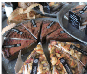
ヴィーガンスイーツ