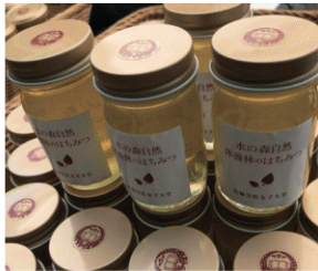
水の森産天然はちみつ